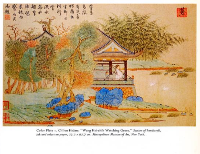
Color Plate 1. Ch'ien Hsüan: "Wang Hsi-chih Watching Geese." Section of handscroll, ink and colors on paper, 23.2 x 92.7 cm. Metropolitan Museum of Art, New York.

Aynı şekilde, Kubilay idaresindeki Yuan Hanedanlığında sanat alanında da önemli gelişmeler kaydedilmiştir. İlgili yerde isimden bahsedilen ressam ve Hanlin akademisinde görevli Zhao Mengfu'nun eşi Guan Daosheng, bu dönemin en meşhur kadın ressamı olarak bilinmektedir. Aynı şekilde şair kimliği ile de bilinen Guan Daosheng'in resimlerinde bambu, orkide ve çiçek açmış ağaç çizimleri ön plandadır. 1261 senesinde Kubilay Han'ın emriyle üç binden fazla mücevher sanatçısı ve hakkâk Hanbalık'a getirilmiş ve onlara bir takım ayrıcalıklar tanınmıştır. Kubilay Han döneminde zanaatkârlar için her zanaat dalının ayrı dairesinin olduğu bir idarî teşkilat da tesis edilmiştir. 1279'da Kubilay Han'ın oğlu Jingim'in portresini tamamlayan Li Guandao bu dönemin en önemli ressamlarından bir diğeri olup eserinin çok beğenilmesinden ötürü saray ressamı görevine getirilmiştir. (Yavuzcan, 2021: s. 107-109).