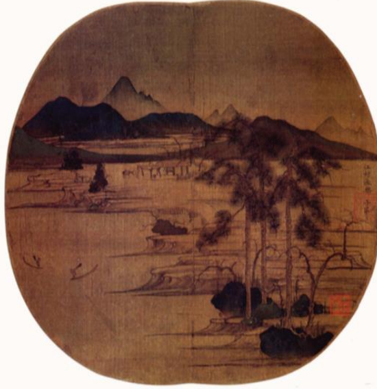
Color Plate 1. Chao Meng-fu: "River Village: The Pleasures of Fishing." Fan-shaped album leaf, ink and colors on silk, 22.9 x 29.8 cm. Collection of C. C. Wang, New York.