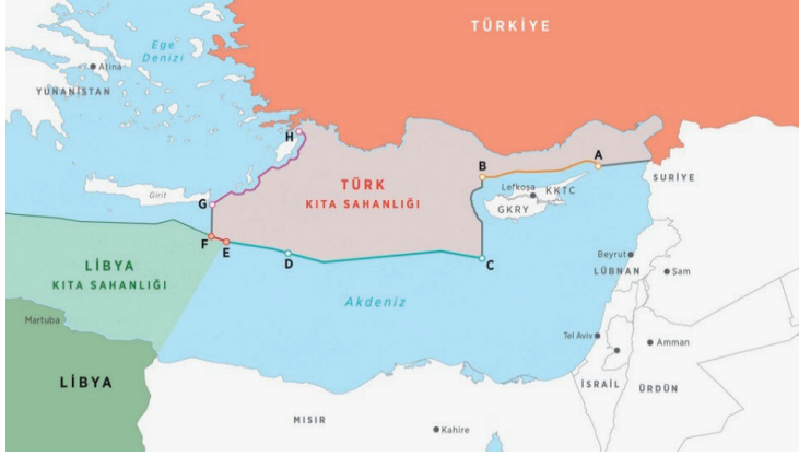
Şekil 3: Türkiye'nin Doğu Akdeniz'deki kıta sahanlığı/münhasır ekonomik bölge sınırları 45

Mutabakat ile Doğu Akdeniz'de ilk defa münhasır ekonomik bölge sınırlandırması yapan Türkiye hem kendisine bölgesel bir müttefik bulmuş hem de Doğu Akdeniz'de Türkiye'nin aleyhine olan dengeleri değiştirmiştir. 46 Türkiye için oldukça kritik bir hamle olan bu anlaşma, KKTC ile imzaladığı deniz yetki alanları sınırlandırma anlaşmasında olduğu gibi, Türkiye'nin Doğu Akdeniz'deki hidrokarbon yatakları üzerindeki hakları göz ardı edilerek yapılan arama ve sondaj faaliyetlerinin de önünü kesmiştir. 47 Bir yandan da Türkiye'nin bu mutabakat ile belirlenen kıta sahanlığında yürüteceği doğal kaynak arama ve işletme faaliyetlerine meşru bir zemin kazandırmıştır. 48 Ayrıca bu mutabakatla Türkiye, GKRY'nin kıyıdaş ülkelerle yaptığı Deniz Yetki Alanlarının Sınırlandırılması antlaşmalarına hukuk temelinde itiraz eden bir ülke olmakla kalmayıp, hukuki zemin oluşturan ve bu hukuki yaklaşımları fiilen uygulayan bir ülke haline gelmiştir. 49