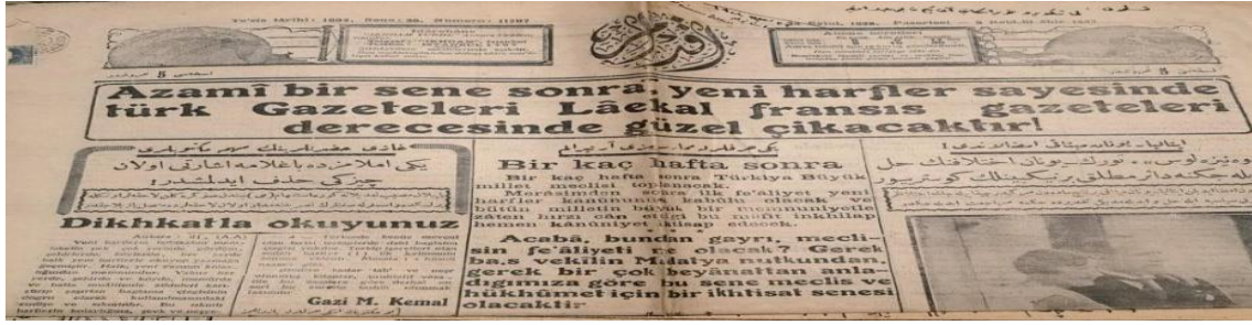
Şekil 2. Kanıt 2. 24 Eylül 1928 İkdam Gazetesi

Kanıt 2'deki İkdam Gazetesi üzerine öğrencilerle gerçekleşen diyalog şu şekildedir: