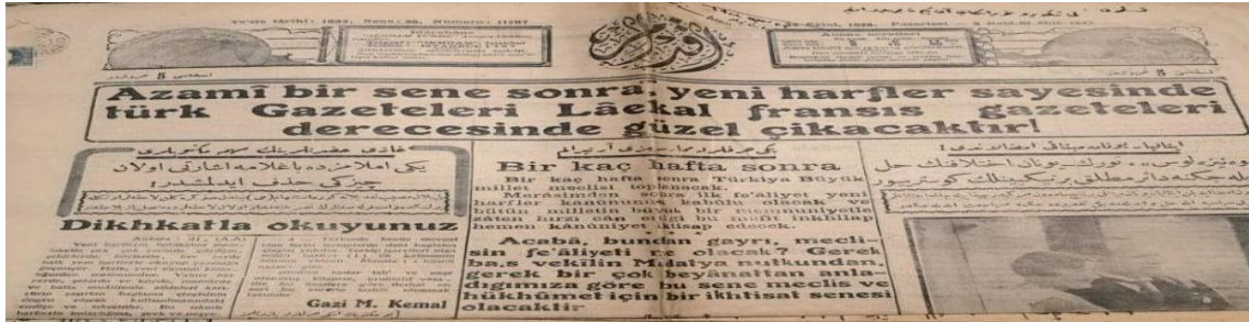
Şekil 1. Kanıt 1. 27 Haziran 1928 Milliyet Gazetesi

27 Haziran 1928 tarihli Milliyet Gazetesine ilişkin araştırmacı ve öğrenciler arasında gelişen sınıf içi diyaloglar