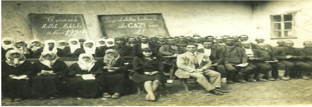
Şekil 4. Kanıt 6. 15 Kasım 1929 Elmacık Millet Mektebi

“Gazi nasıl on sene evvel düşmanları vatan topraklarından atmak için milleti seferberliğe çağırdı ise şimdi de Türk yurdundan cahilliği kaldırmak için seferberlik ilan etti. Türkiye’de kadın erkek herkes okumak, yazmak bilecektir, bu ülkede artık okuma bilmeyen kalmayacaktır. İşte Millet Mektepleri bunun için açıldı” (‘Millet Mektepleri’, Halk Gazetesi, 11.2.1929, s. 1.).