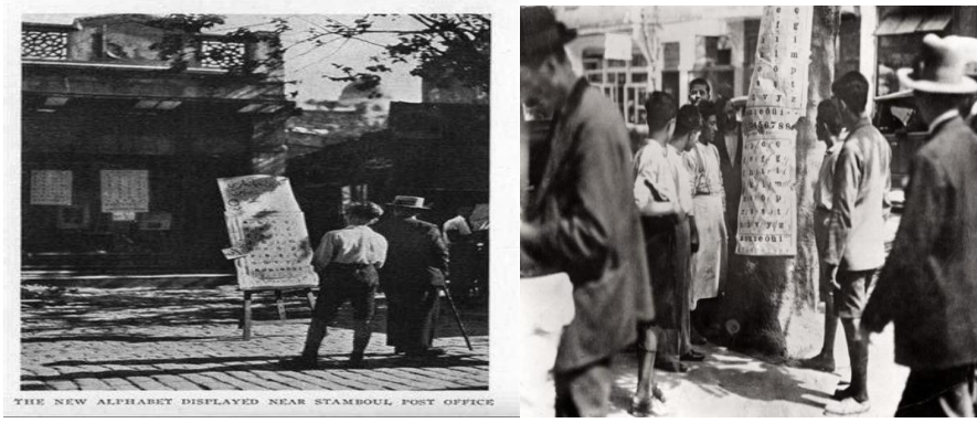
Şekil 3. Kanıt 3. Alfabenin Meydanlarda Tanıtımı

Kanıt 3'teki alfabeyi tanıtan fotoğraflar üzerine öğrencilerle gerçekleşen diyalog şu şekildedir: